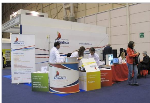
Figura 8 - Evento Futurália

18 Março 2011: Realização de medições de peso, estatura e cálculo de Índice de Massa Corporal (IMC) para avaliação do estado nutricional da população visitante da Futurália evento desenvolvido na Feira Internacional de Lisboa/Parque das Nações (Figura 8) .