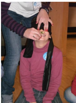
Figura 3 - Jogo dos sentidos

São preparadas várias amostras de frutas e legumes que são colocados em caixas. Seguidamente, tapando os olhos de apenas um elemento do grupo, o monitor dá um pedaço de cada amostra a cheirar e a saborear. Cada criança deve tentar identificar, após cada acção de experimentação dos sentidos, a que fruta ou legume corresponde a amostra. Nesta actividade, todas as crianças experimentam estas sensações.