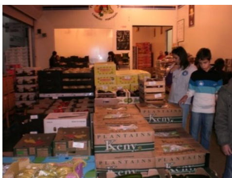
Figura 5 - Visita a um pavilhão de frutas e hortícolas

As crianças ficam a conhecer os espaços onde se comercializam os diversos produtos hortofrutícolas, têm a possibilidade de observar/realizar métodos de conservação de alimentos, análise de rótulos, variedades e sazonalidade dos hortofrutícolas, entre outras matérias exploradas de acordo com o ano de escolaridade das crianças em causa. Nesta visita os alunos e professores têm a oportunidade de conhecer novas frutas e hortícolas.