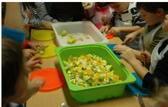
Figura 4 - Preparação da salada de frutas

18 Outubro 2010- até Abril 2011: Visita guiada a um pavilhão de venda de frutas e hortícolas assim como o restante espaço exterior do MARL. Para cada dia da semana é atribuído um armazém de venda de frutas e/ou hortícolas: