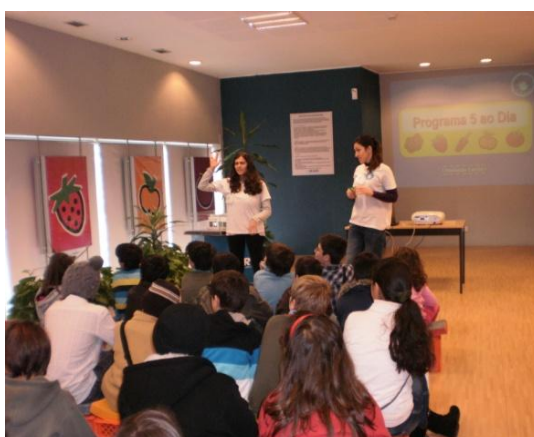
Figura 2 - Apresentação da Sessão informativa

Na acção “Alimentação Saudável”, as crianças ficam a conhecer qual o objectivo do Programa “5 ao Dia” e o porquê da sua existência, quantas refeições devem fazer por dia, as vantagens do consumo de frutas e hortícolas e as desvantagens de fazer uma alimentação desequilibrada. A sessão tem como objectivos, dar a conhecer alguns benefícios das frutas e legumes, incentivar os destinatários a fazerem uma alimentação saudável e promover o consumo, de pelo menos, cinco peças de fruta ou hortícolas por dia.