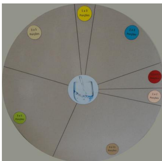
Figura 6 - Nova Roda dos Alimentos

10 a 14 de Janeiro – Elaboração da nova roda dos alimentos em formato A1 com o intuito de ser utilizada posteriormente no Programa “5 ao Dia”. Nesta actividade cada criança cola os alimentos que lhe são dados nos vários sectores da nova roda dos alimentos. Esta actividade pretende tornar a sessão informativa mais didáctica e divertida ( Figura 6 ).