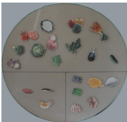
Figura 7 - Prato Saudável

3 Março 2011: Elaboração de um prato saudável interactivo, esta actividade pretende que as crianças aprendam de forma divertida como deve ser constituído um prato saudável. Com esta actividade pretende-se que as crianças coloquem os alimentos que lhes são dados nos três sectores do prato (Figura 7) .