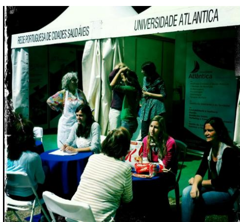
Figura 9 - Sessão: “Como realizar um plano alimentar saudável”

1 Maio: Participação nas actividades desenvolvidas pelo Departamento de Ciências da Nutrição da Universidade Atlântica durante a Semana da Saúde de Oeiras ( Figura 9 ). ( Anexo XI )