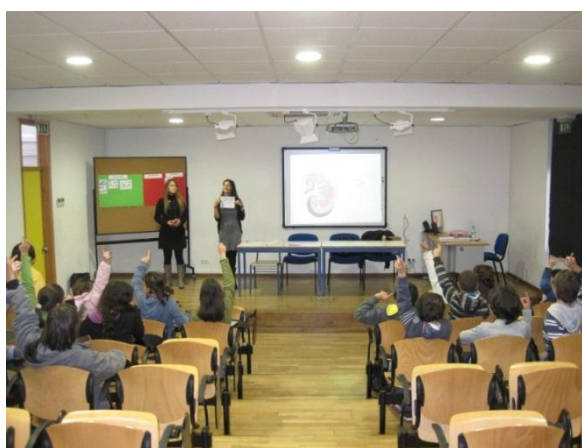
Figura 2 – Palestra “Alimentação Saudável” aos alunos do 5º ano da Escola Básica EB 2/3 de Albarraque

Os alunos e professores demonstraram muito interesse no tema e fomos recebidas da melhor forma possível pelos responsáveis do projecto.