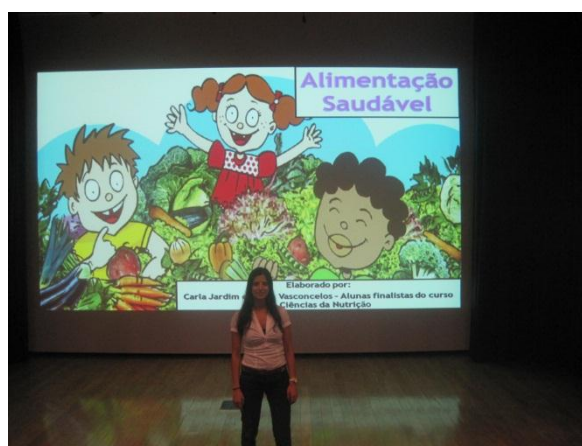
Figura 5 – Palestra “Alimentação Saudável” aos alunos do 2º ano do ensino básico da ESSA